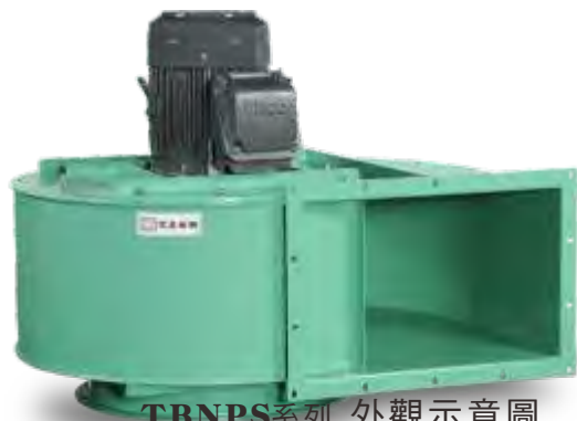
TBNPS系列 外觀示意圖 TBNPS SERIES IMAGE