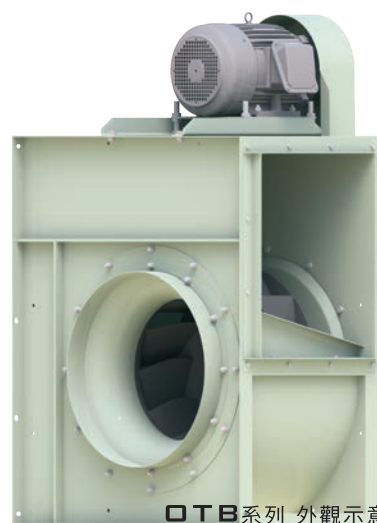
OTB系列 外觀示意圖 OTB SERIES IMAGE